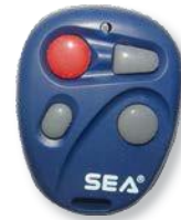
Радиобрелок БЛ СЕА