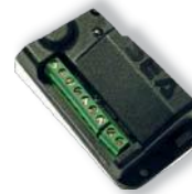
Приемник СЕА ФЛЕКС ЮНИ