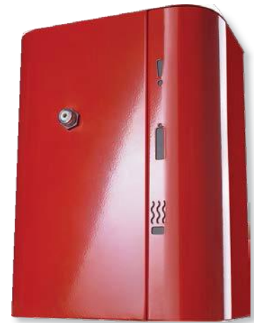
Генератор тумана АВАРКО ФАСТ 03 1С

Генератор тумана может быть подключен к охранной сигнализации магазина и выполнять функцию защиты, активируясь при переходе сигнализации в режим «тревога».